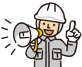
登録ストックヤードへの搬出を予定している大手ゼネコン会社

熱海における土石流災害や盛土規制法の制定などを受けて、我が社でも建設発生土の有効利用、適切な搬出先管理に取り組んでいるところです。令和6年6月以降は、元請業者が最終搬出先を確認することが必要になりますが、 ストックヤードを経由する場合、最終搬出先までの追跡が困難になることが想定されるので、登録ストックヤード事業者を活用する予定です。 発注者からもコンプライアンス（法令遵守）を厳しく求められることもあり、取引のあるストックヤード事業者には、早期の登録を働きかけています。