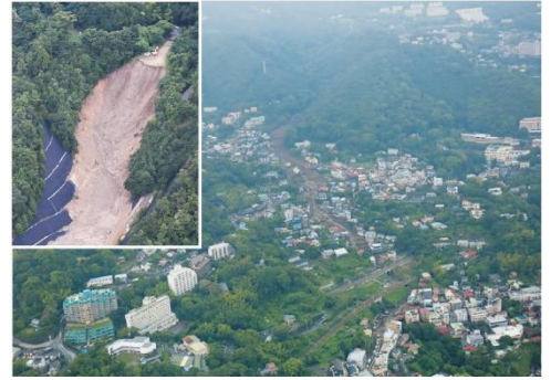
R3.7 静岡県熱海市 死者28名、住宅被害98棟

つまり、登録ストックヤード運営事業者の皆様は、建設発生土の適切な利用・処分に向けた枠組みの一翼を担う主体となります。